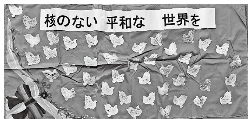
(メッセージタペストリー)